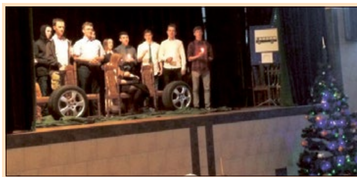
Wigilia jest zawsze wtedy, kiedy my tego chcemy. (Edi)