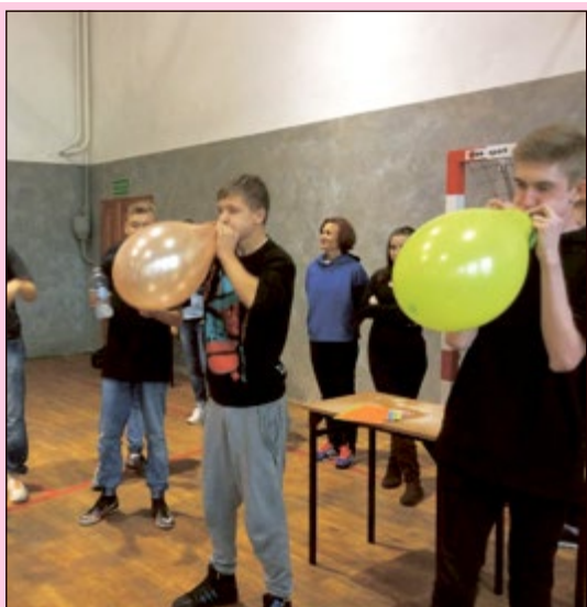
- Niech Moc będzie z wami. (Gwiezdne wojny)