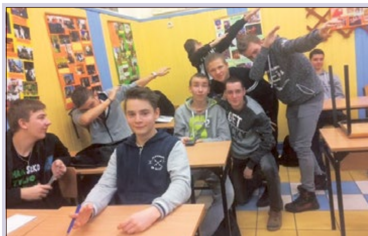
Carpe diem. Chwytajcie dzień chłopcy. Uczyńcie wasze życie niezwykłym. (Stowarzyszenie Umarłych Poetów)