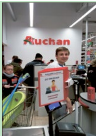
Wolontariusz PCK podczas akcji „Czerwonokrzyżska gwiazdka” w Auchan. „Obym nigdy nie był tak zajęty swoimi sprawami, by nie zareagować na potrzeby innych ze współczuciem i życzliwością” (Thomas Jefferson).