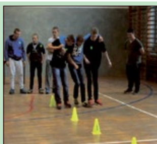
- Mówisz do mnie? (Taksówkarz)