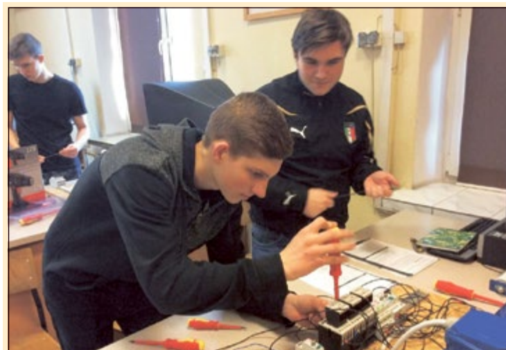
- Houston, mamy problem. (Apollo 13) - Dzięki fantastycznej metodzie dedukcji dojdziemy do tego, mój drogi Watsonie. To przecież elementarne. (Sherlock Holmes)