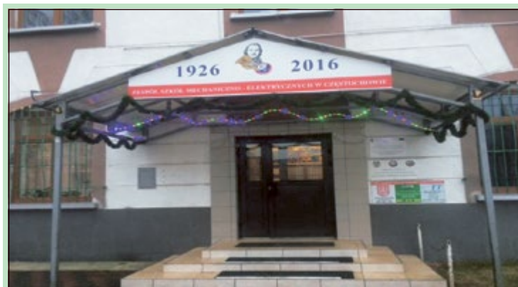
90 lat minęło. (Czterdziestolatek)