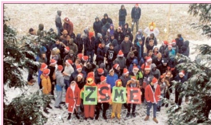
Nadchodzi zima. (Gra o tron) Atak klonów. (Gwiezdne wojny)