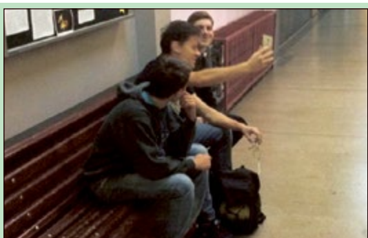
- Może tak selfie przed lekcją?