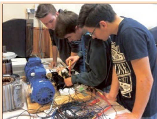
- Czekajcie, czekajcie, chwilę, jeszcze niczego nie słyszeliście. (Spiewak Jazzbandu)