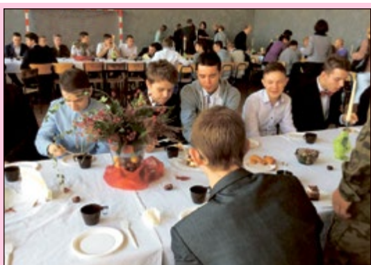
Człowiek musi znać swoje ograniczenia. (Sila magnum)