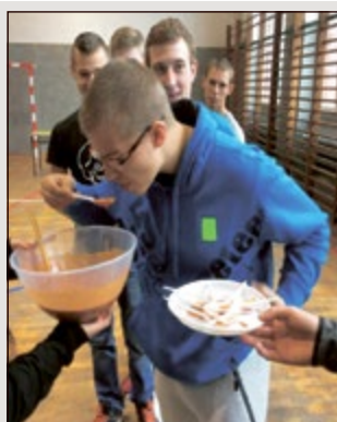
- Cóż, nikt nie jest doskonały. (Pół żartem, pół serio)