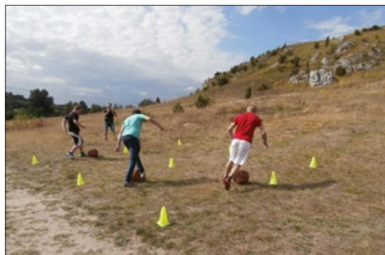
Wiele emocji budził tor przeszkód i ...

Następnym wyzwaniem okazały się zawody sprawnościowe wśród skał.