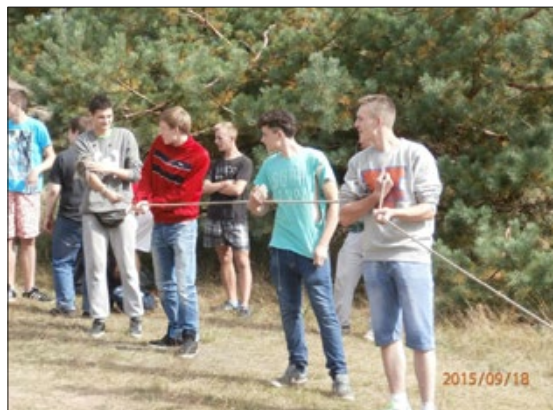
... przeciąganie liny.